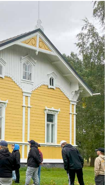
Lukuretkellä Torstilan kartanoon seitsemäsluokkalaisten tutustuivat kartanomiljööseen sekä kotikunnan historiaan ja kulttuuriin.