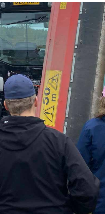
erikoistuneen kartanon työko-